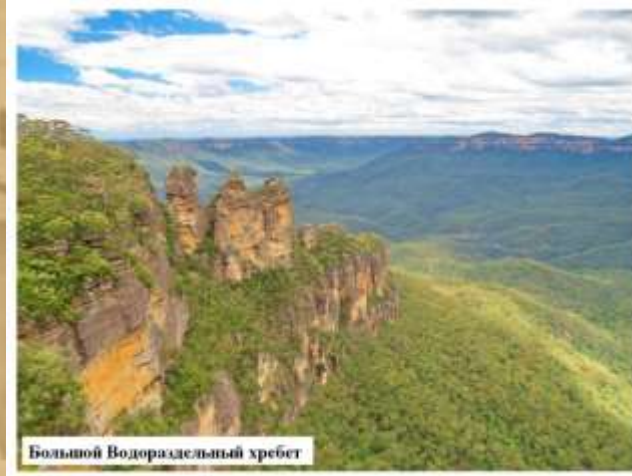
Большой Водораздельный хребет

Большую часть территории страны занимают обширные пустыни и низменные территории. Наиболее известные пустыни: Большая Песчаная пустыня, Большая пустыня Виктория. На востоке материка находятся сильно разрушенные, невысокие горы— Большой Водораздельный хребет.